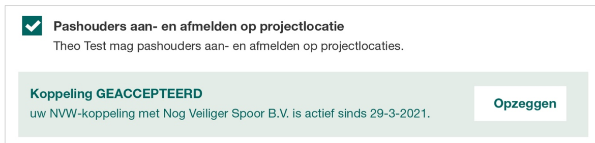
Afbeelding 4: de actieve status van de koppeling in het rechtenscherf

Indien een koppeling door de erkend werkplekbeveiligingsorganisatie is geaccepteerd, zien we in het profiel van de VVF de actieve status van de koppeling terug in het rechtenscherf, onder de rol Pashouders aan- en afmelden op projectlocatie .