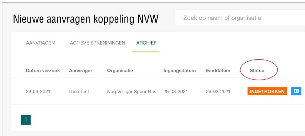
Afbeelding 4: het archief

Het laatste tabblad geeft de organisatie een overzicht van koppelingen uit het verleden. Hier worden alle koppelingen getoond die zijn afgewezen, ingetrokken of gedeactiveerd.