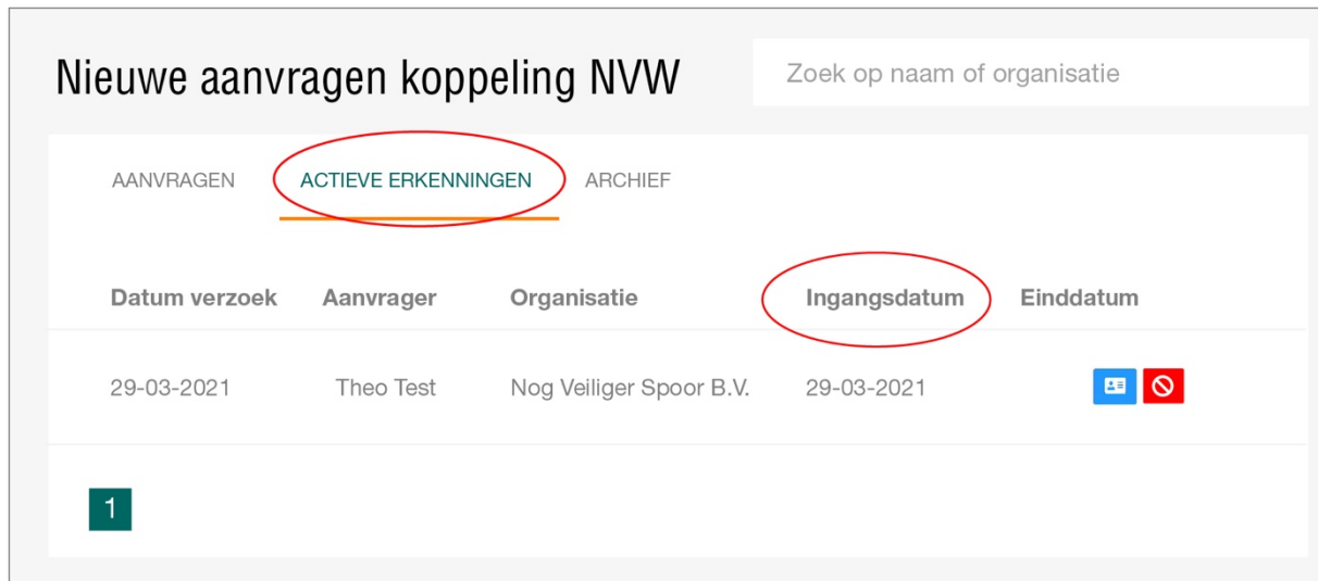
Afbeelding 3: Actieve erkenningen

Wanneer de koppeling is goedgekeurd zal deze verschijnen onder het tabblad Actieve erkenningen . De koppeling is dan voorzien van een ingangsdatum .