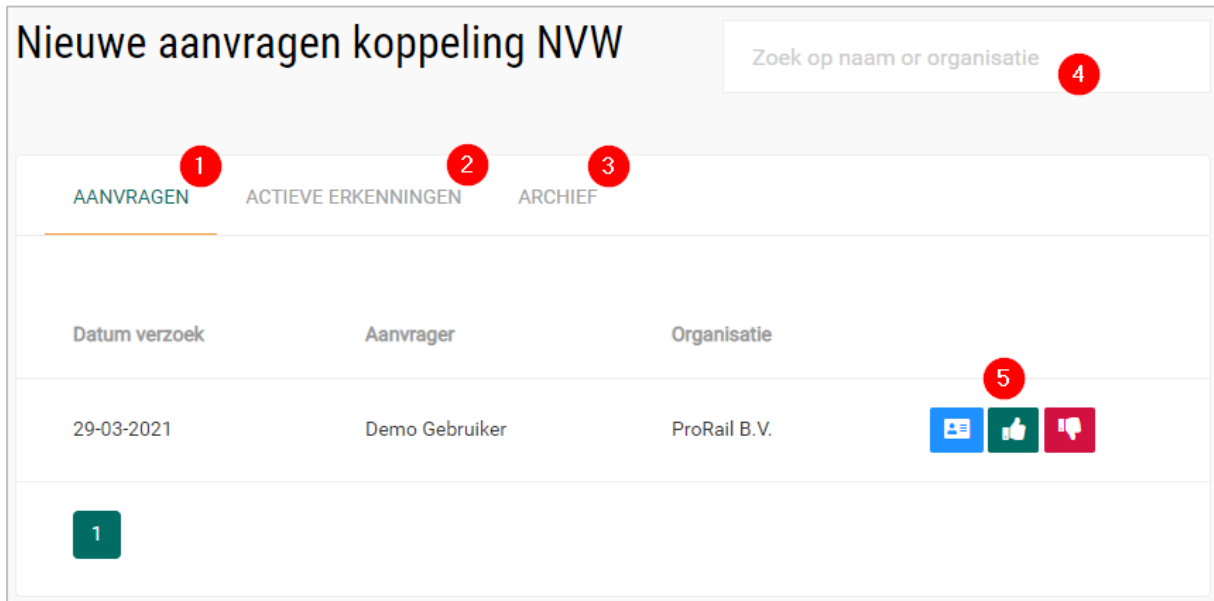
Afbeelding 1: dashboard voor nieuwe koppelingsverzoeken

Zodra de key user van de aanvragende VVF een verzoek heeft ingediend (door middel van het selecteren van een erkend werkplekbeveiligingsbedrijf of personeelsteller), ontvangt die organisatie een e-mail met daarin de mededeling dat er een nieuw verzoek is aangemaakt met een link naar de desbetreffende pagina.